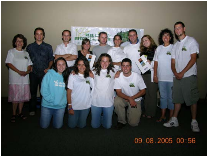
Student Forum Lady of Fatima Festival