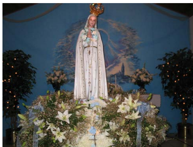
Festa da Sr. De Fatima