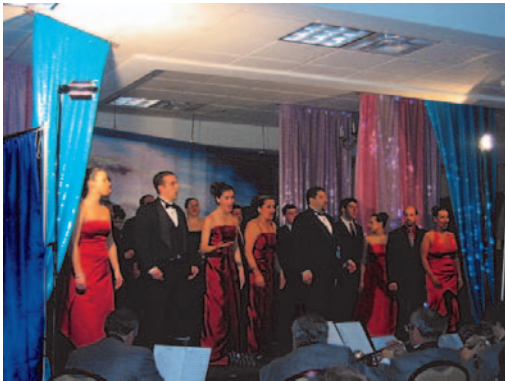
Friends of Terceira - Show:

Equal Opportunity Employer - 978-562-5309 - 877-7CHAVES.