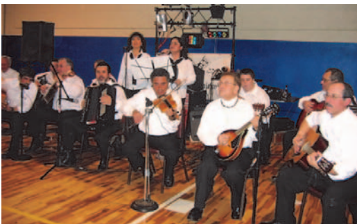
Tuna at the Wine Tasting Event